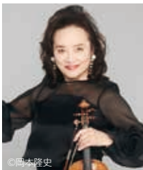
ヴァイオリン 前橋汀子