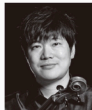
[ヴィオラ] 中村洋乃理 (NHK交響楽団次席奏者)