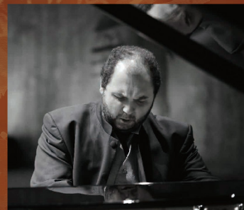
ピアノ ヴァハン・マルディロシアン

助成: 文化庁文化芸術振興費補助金(劇場・音楽堂等機能強化推進事業) | 独立行政法人日本芸術文化振興会