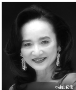
ヴァイオリン：前橋 汀子 Violin: Teiko Maehashi

支えてくださる皆様への感謝を込めて、山形市を音楽で満たし、皆様に活力をお届けします。