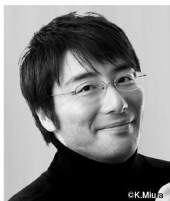
指揮：大井 剛史 Conductor: Takeshi Ooi

95年プザンソン国際指揮者コンクール優勝。96年京都府文化賞奨励賞、97年ABC国際音楽賞、2000年京都市芸術新人賞、ホテルオークラ音楽賞、04年渡邊暁雄音楽基金音楽賞、06年藤堂頭一郎音楽賞、20年京都府文化賞功労賞受賞。