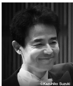
指揮：阪 哲朗 Conductor: Tetsuro Ban

京都市出身。欧米での客演も数多く、おもにドイツ、オーストリアなどでオーケストラ、歌劇場に招かれ成功を収めている。日本においては、主要オーケストラ、新国立劇場、二期会などのオペラ団体を指揮している。現在、山形交響楽団常任指揮者、びわ湖ホール芸術参与。